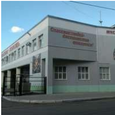
Пожарно-спасательная часть №4 ФГКУ"13 ОПС по Тверской области"

Повышение качества научно-исследовательской работы и инновационной деятельности УНЛ и ДОУ по психолого-педагогической тематике.