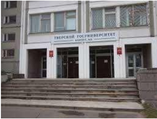
ФГБОУВО «Тверской государственный университет» https://www.tversu.ru